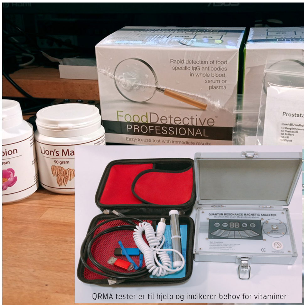
QRMA tester er til hjelp og indikerer behov for vitaminer